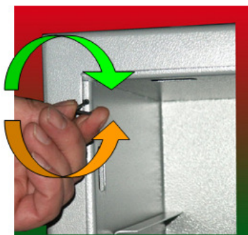
górną śrubą regulacyjną