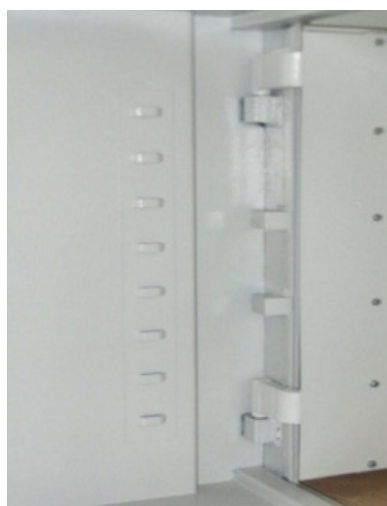
1. widok zawiasów drzwi

Regulację i smarowanie można wykonać tylko przy drzwiach otwartych. Wysokości drzwi ustawia się regulując kluczem imbusowym wkręty MB w łożyskach obrotowych zawiasów wewnętrznych