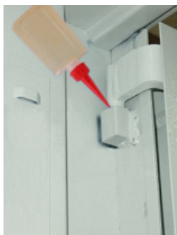
4. zawias górny