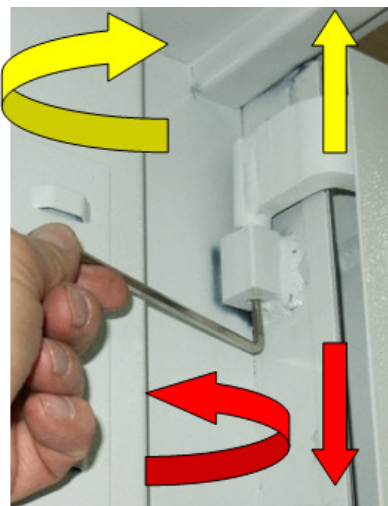
2. zawias górny