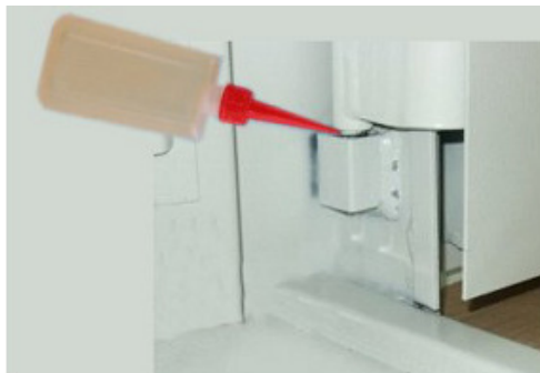
5. zawias dolny

Nanieść niewielką ilość smaru w płynie pomiędzy górną i dolną część zawiasu, wytrzeć ściekający płyn. Do użycia nadają się wszystkie smary płynne dostępne w handlu. Częstotliwość smarowania zależy od tego, jak często używa się sejfu. Należy je wykonywać co najmniej raz w roku.